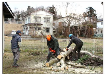
業者さんによる伐採の様子

市民センターの敷地内(13区防災倉庫脇)にあったシラカシの木2本を、今年1月6日、市の事業費により伐採しました。背丈が伸びすぎて、隣の敷地へ大きくはみ出していたためです。シラカシは大変大きくなる木だそうで、残りの3本の伐採については検討する予定です。