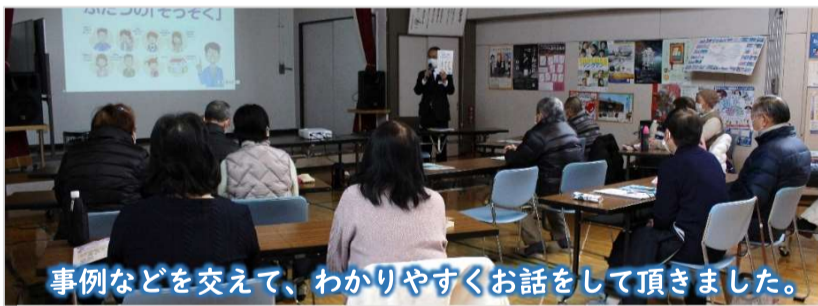
事例などを交えて、わかりやすくお話をして頂きました。