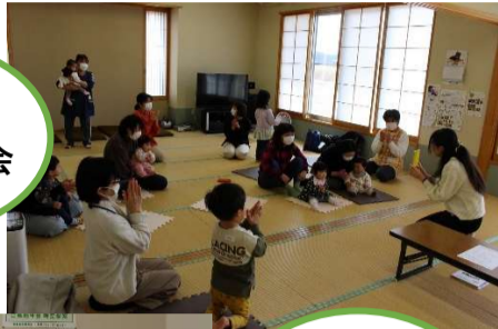
おはなし会& 子育てサロン スタッフ