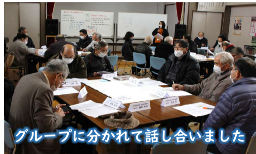
グループに分かれて話し合いました

参加者から「高齢化している」「役員のみ手がない」等困りごとが共有でき「有意義だった」「交流が何より大切」と前向きな意見が出されました。