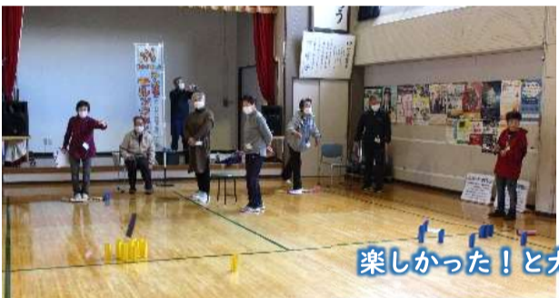
楽しかった！と大好評でした

「モルック教室」を3月6日、13日、20日に開催、延べ28名の参加があり毎日にぎやかに楽しくプレーをしていました。チームで作戦を立てて、倒す棒(スキttl)を狙ってモルックを投げていました。なかなか思うように当たらなかつたりしていましたが、和気あいあいとプレーしていました。大変好評だったことから、屋内用と屋外用を当センターで購入することにしました。是非、ご利用下さい。