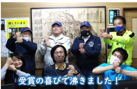
受賞の喜びで沸きました！