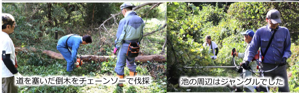
道を塞いだ倒木をチェーンソーで伐採