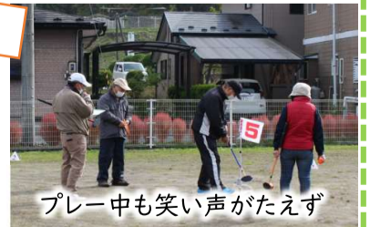
プレー中も笑い声がたえず