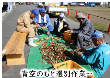
青空のもと選別作業~

私も収穫させて頂きました。昨年、大変な思いをして、マイスコップ持参で頑張りました☺芋の子汁作ろうと思ひます☺スタッフの皆さん、ありがとうございました。