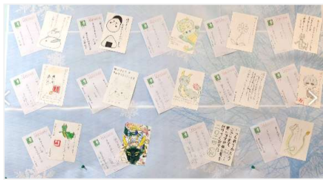
個性豊かで見ごたえあり!

新年のご挨拶にと、総合文化部1年、2年の生徒の皆さんから、素敵な年賀状を頂きました!個性豊かで、さすが文化部!という凝ったデザインから優しい言葉など様々な年賀状。大変うれしく、センターの玄関に展示させて頂いております。皆さん本当にありがとうございました!